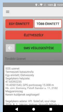
Az SMS véglegesítése