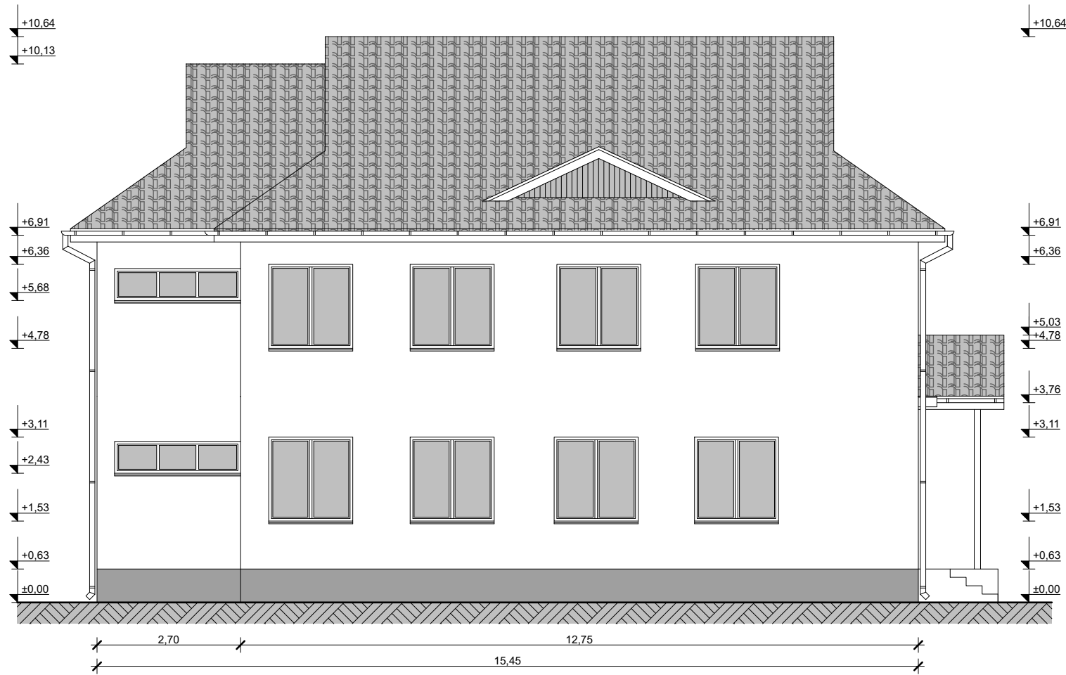
ÁLLAPOT NYUGATI HOMLOKZAT M=1:100